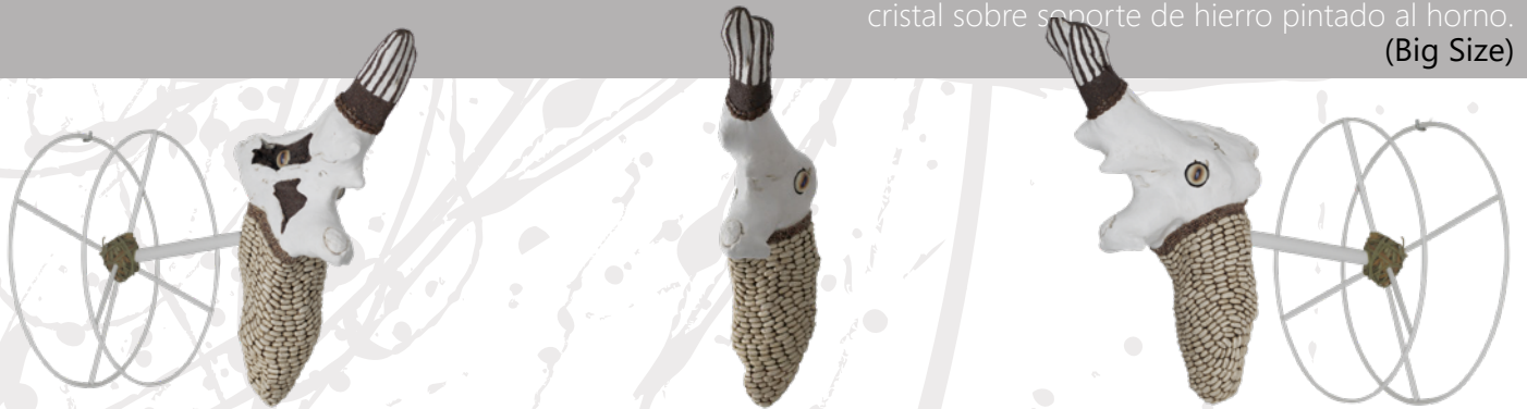
LAND DISPLACED · WILDLIFE Madera de olivo, semilla de nabina roja, algarrobo, yeros, alubia blanca, acrílico, esparto y ojos de cristal sobre soporte de hierro pintado al horno. (Big Size)