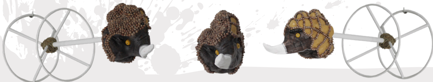
Madera de olivo, semilla de yeros, acrílico, esparto y ojos de cristal sobre soporte de hierro pintado al horno. (Small Size)