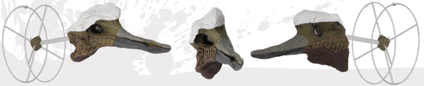
LAND DISPLACED · WILDLIFE Madera de olivo, semilla de yeros, colza, acrílico, rotuladores permanentes, esparto y ojos de cristal sobre soporte de hierro pintado al horno. (Big Size)