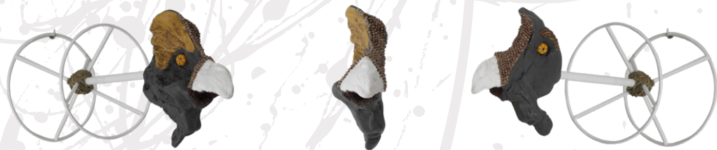
Madera de olivo, semilla de yeros, nabina roja, acrílico, esparto y ojos de cristal sobre soporte de hierro pintado al horno. (Small Size)