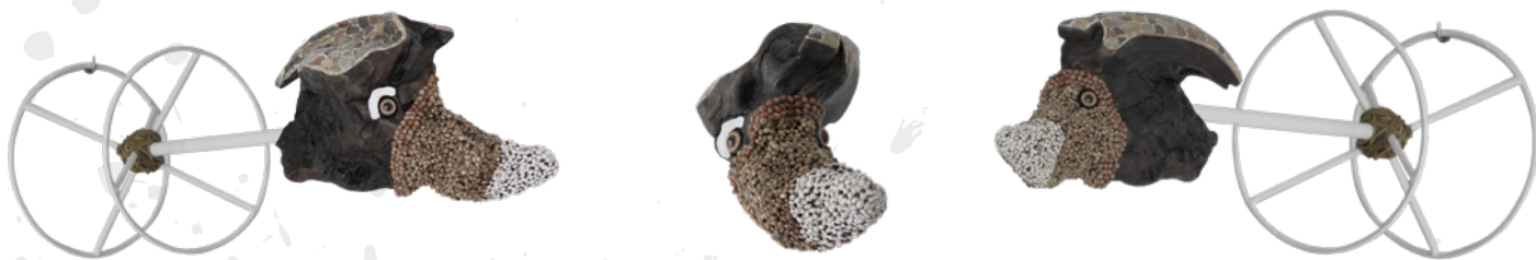
Madera de olivo, semilla de yeros, cáñamo, acrílico, esparto y ojos de cristal sobre soporte de hierro pintado al horno. (Small Size)