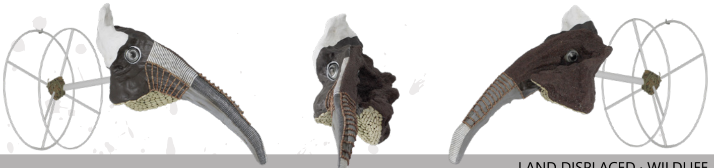
LAND DISPLACED · WILDLIFE Madera de olivo, semilla de yeros, colza, alubia verdina, acrílico, rotuladores permanentes, esparto y ojos de cristal sobre soporte de hierro pintado al horno. (Big Size)